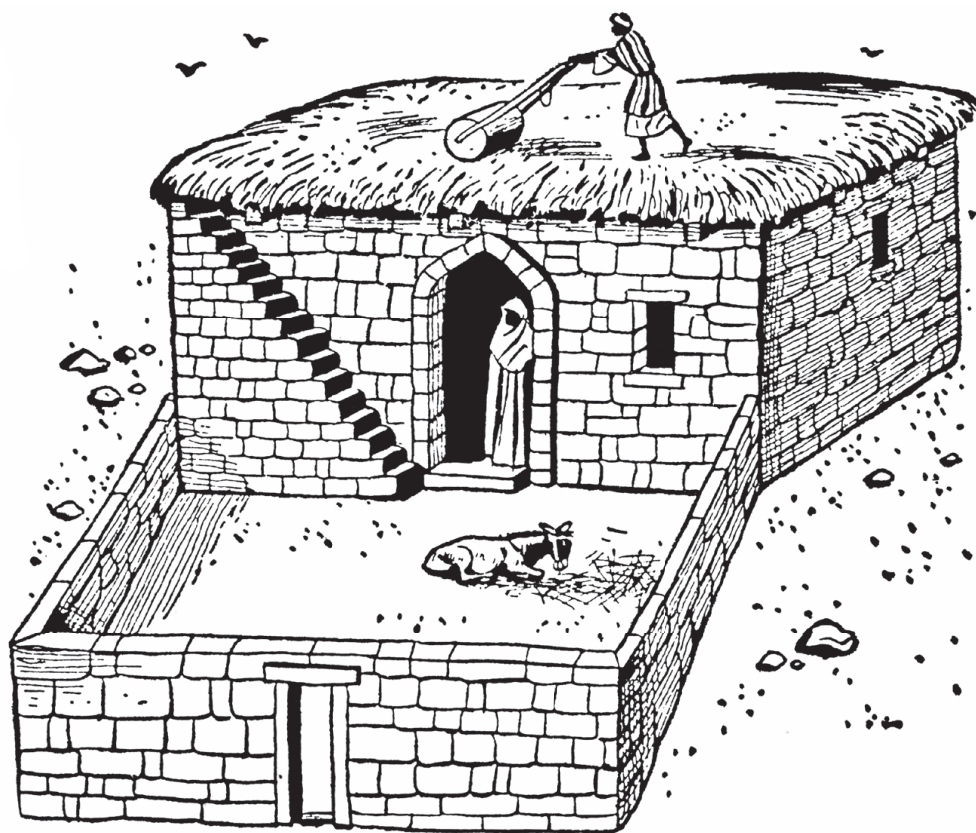
Casa de un solo cuarto.

La palabra hebrea bavith y la palabra árabe bait quieren decir “abrigo”. El equivalente español es la palabra “casa”. El término más significativo “hogar” nunca ha sido inventado por los hijos de Palestina, porque ellos se consideran como “peregrinos en la tierra”. Su tienda y su casita le proveyeron abrigo suficiente para él y sus familiares durante la peregrinación terrenal.