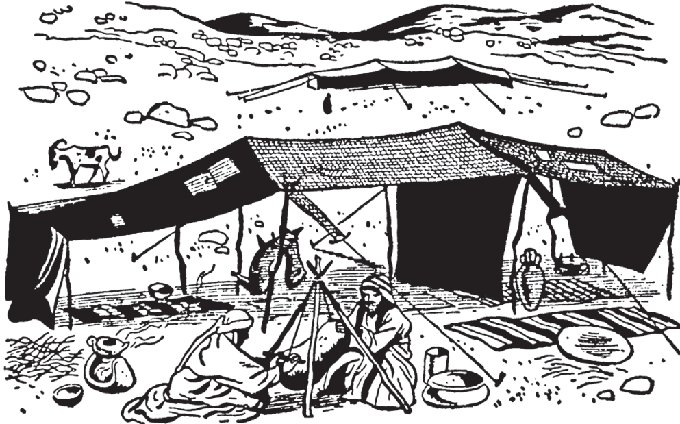
Tienda de pelo de cabra.

como signo de humillación (1 R. 29:1); y como signo de arrepentimiento (Dn. 9:3; Jon. 3:5).