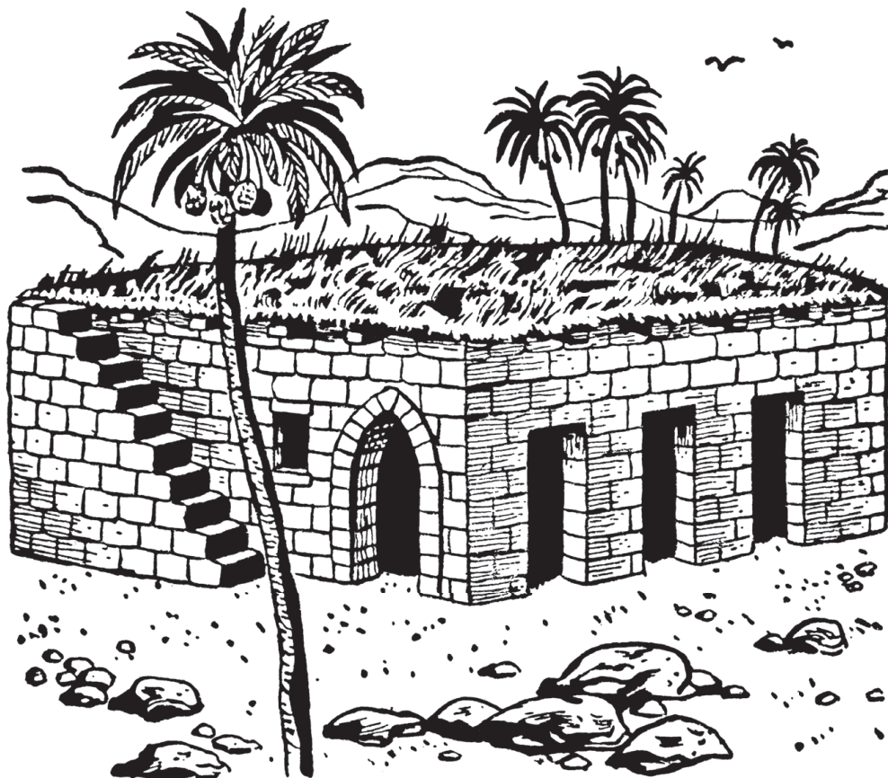
Techo de una casa oriental.

sangre sobre tu casa, si de él cayere alguno” (Dt. 22:8). El uso común de la casa para tantas cosas hizo esencial esta ley, como podemos comprender.